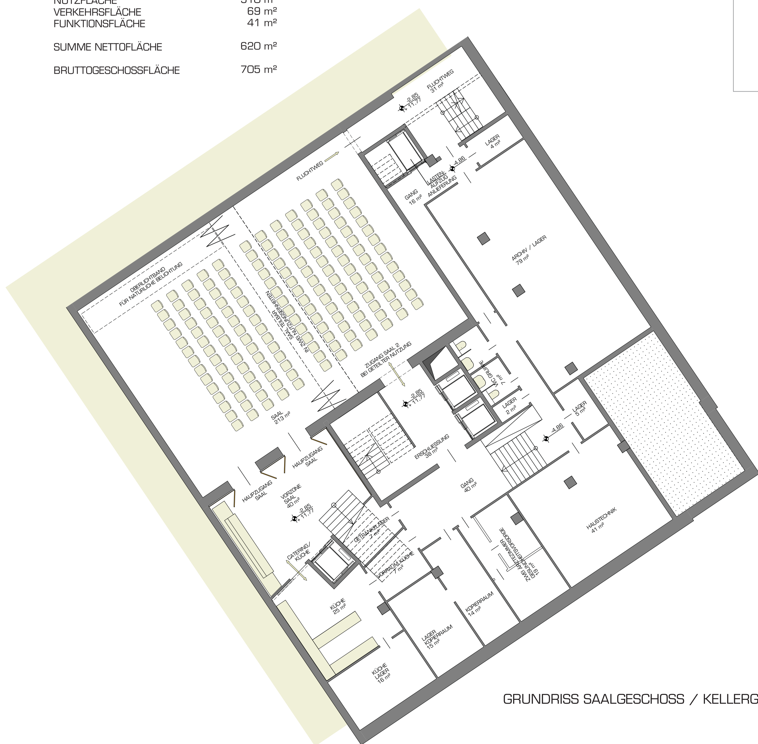
GRUNDRISS SAALGESHOSS / KELLERGEHOSS M 1:100