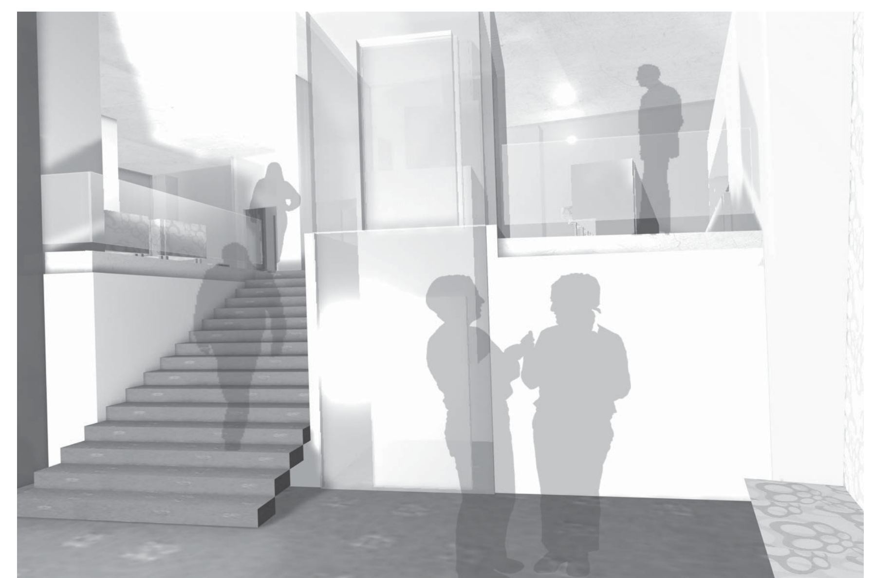
VORBEREICH SAAL- STIEGENAUFANG ZU FOYER