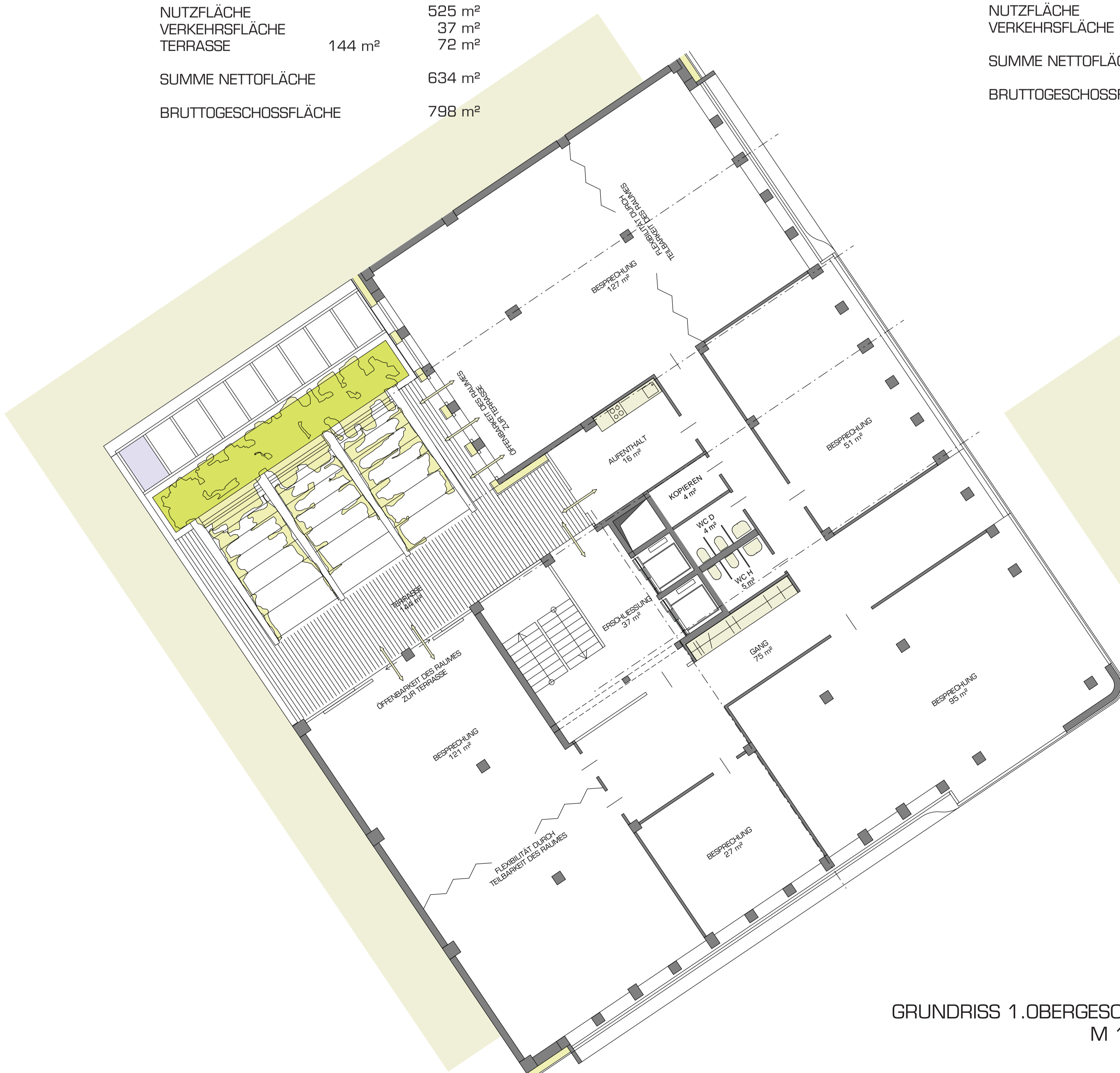
GRUNDRISS 1.OBERGESCHOSS M 1:100