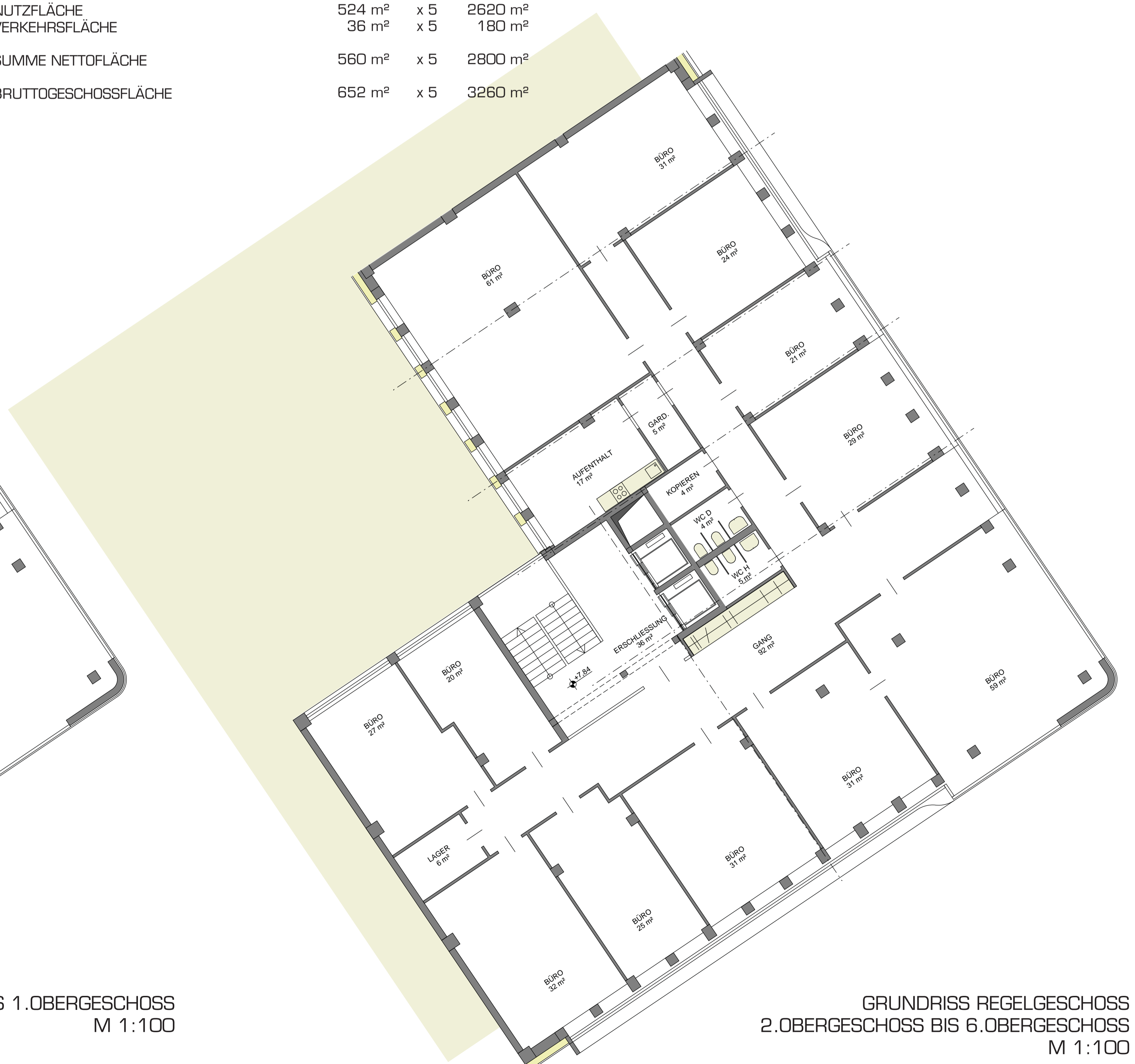
GRUNDRISS REGELGESCHOSS 2.OBERGESCHOSS BIS 6.OBERGESCHOSS M 1:100